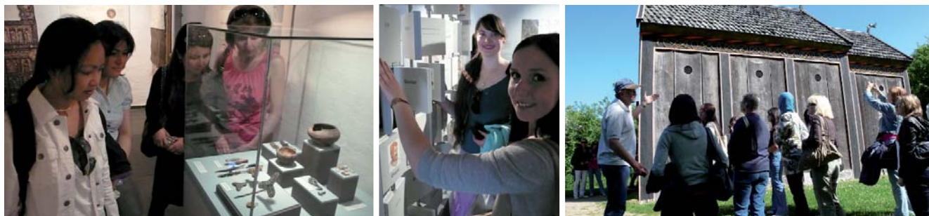
DU 3 kursisterne studerer oldsager, runeskrift og til højre trækirken.

Den verden, vi ser i dag, har dybe rødder tilbage i tiden, så den historiske dimension udgør uundgåeligt en væsentlig del af kulturformidlingen. For faget dansk på Sprogcentret har flere aspekter, der udover det rent kommunikative også skal give forståelse af vor kultur, set i et historisk og globalt perspektiv. I den forbindelse har DU 3 kursisterne netop været på en spændende og lærerig ekskursion. Det drejer sig således om skole- og studievante kursister, og turen gik op til Moesgård, der udover at være en del af Århus Universitet også rummer uhyre fine udstillinger om temaer, der sætter fortiden og udviklingen i en større sammenhæng. Det giver et godt oplevelsesmæssigt supplement til undervisningen i klassen, der selv sagt er mere bogligt orienteret.