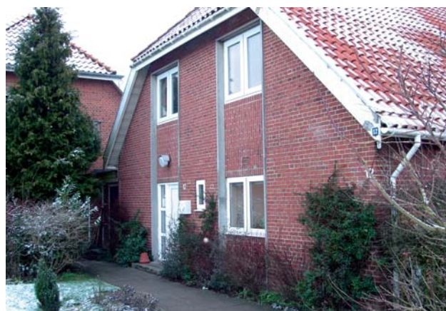
Huset der danner rammerne for VIP projektet