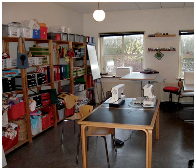
Et kig ind i syværkstedet.

deres liv, sådan at de ikke fastholdes i en utilfredsstillende hverdag. Dette mål kan kun opnås, hvis de involverede borgere ser og føler, at læreren reelt ønsker dem godt og lever med dem i deres glæde, når de har tilegnet sig noget nyt. Arbejdet kræver mange ressourcer på det personlige plan. Ved at vise følelser bliver man sårbar, men uden følelser er der ingen menneskekontakt og heller ingen læring. Mødet med borgerne på Finlandsvej 12 giver mig mange tanker, og oplevelserne efterlader endnu flere overvejelser. Mit arbejde med dette projekt er udfordrende og giver mulighed for personlig og i høj grad også faglig udvikling.