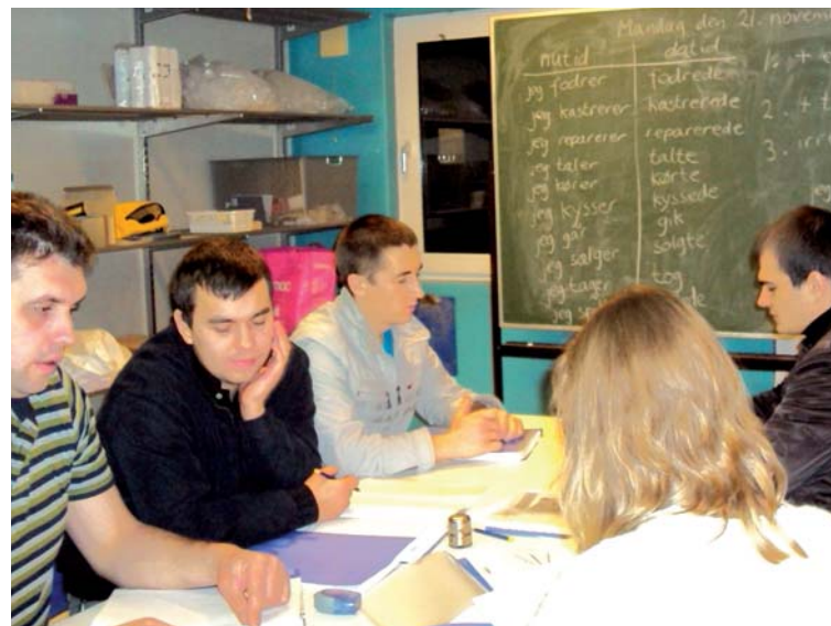
Sådan kan et klasseværelse også se ud. Her midt i miljøet i forkoststuen på en svinefarm.

Rengøringsenheden på Vejle Sygehus henvender sig til Sprogcenter Vejle, idet de har erfaret, at nogle af deres ansatte sommetider har vanskeligt ved at forstå skriftlige samt mundtlige