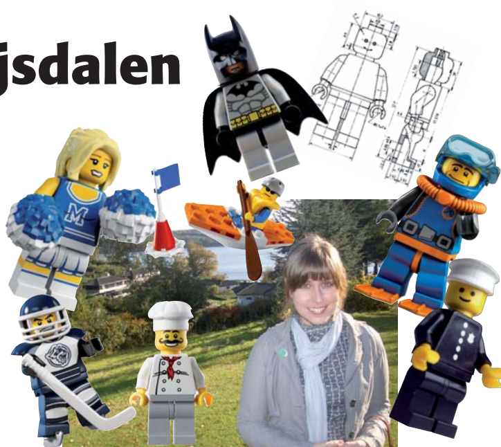
Tara hjemme i Grejsdalen i selskab med minifigurer.

I starten af 2009 indså jeg, at pga. den økonomiske krise ville et arkitektarbejde fortsat være meget svært at finde, så jeg