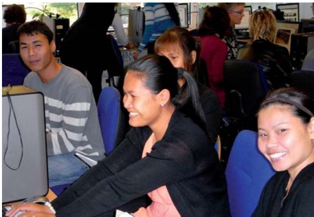
Stor aktivitet i studiecentret.