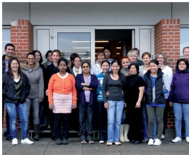
Hele holdet bag "Fredericia Avisen", hvor man bl.a. kan læse om boligsøgning, mad, politik og aktiviteter i Fredericia.

Næste nummer af avisen udkommer lige før jul.