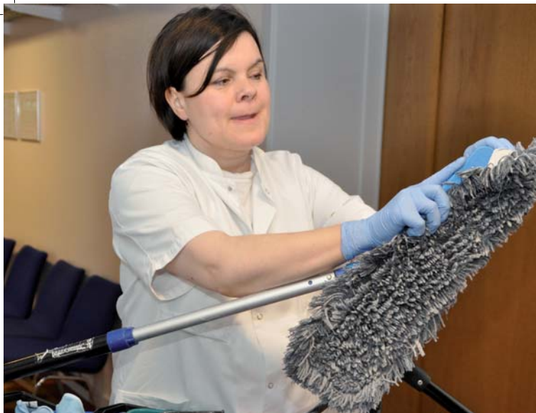
Her gøres der klar til rengøring på Vejle Sygehus.

beskeder. De ansatte har alle opholdt sig i Danmark i flere år og har alle færdiggjort en danskuddannelse. Der ønskes derfor fra virksomhedens side en afdækning af de ansattes læsekompetence og en indføring i dansk arbejdsmarkedskultur. Vi modtager diverse skriftlige instruktioner, der vedrører rengøringsassistentens arbejde. Det bliver tydeligt for os, at et praktisk arbejde kræver en veludviklet læsekompetence. Mange informationer skal læses og forstås, før jobbet kan udføres korrekt. Vi begynder så småt at gennemlæse de forskellige tekster og opdager, at der her må tænkes i forskellige læsestrategier. Undervisningen skal tilrettelægges i to spor. En del af undervisningen skal tage udgangspunkt i en forståelse af de krav og forventninger der stilles til en ansat. Eksempelvis: Hvorfor er det vigtigt at gå til møde og være aktiv? Hvad betyder ord som samarbejde og ansvar? Strukturer skal afdækkes og forstås. Den anden del omhandler læsning. Hvilke tekster møder man som rengøringsassistent? Arbejdsplaner, tjeklister, personalehåndbog, dagsordner og mødereferater. Medarbejderne arbejder derfor f.eks. med at læse og forstå en dagsorden med fokus på de informationer og den opstilling en dagsorden har. Der laves fælles forberedelse til det næstkommende møde, og der evalueres på oplevelsen efter mødet er afholdt. De ansatte erkender at de har forstået mere og er tilfredse.